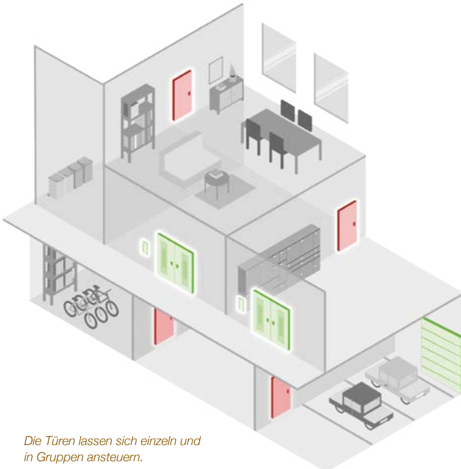
Die Türen lassen sich einzeln und in Gruppen ansteuern.