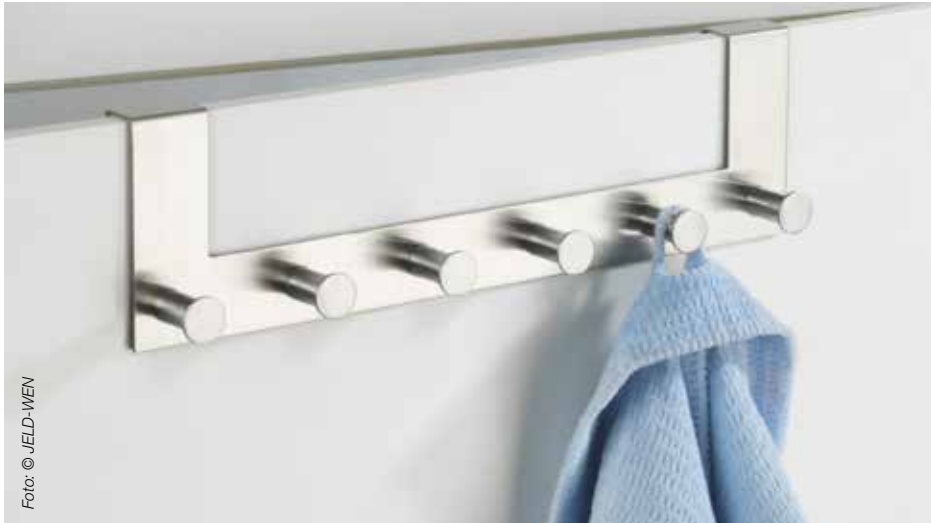
Beliebte Nutzung eines Falzes im Badezimmer – allerdings nur bei Feuchtraumtüren ohne Risiko